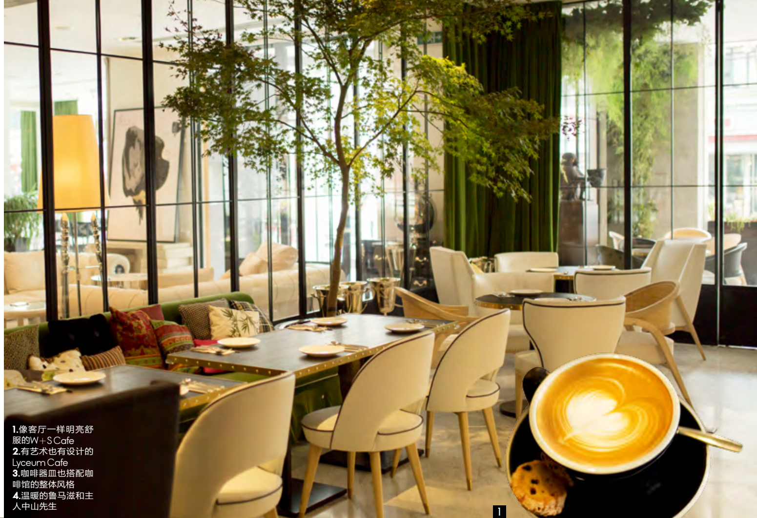
1.像客厅一样明亮舒服的W+S Cafe 2.有艺术也有设计的Lyceum Cafe 3.咖啡器皿也搭配咖啡馆的整体风格 4.温暖的鲁马滋和主人中山先生