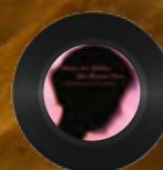
最爱Playlist Bill Evans 《Waltz for Debby》

ELLE plus 精彩内容 更多互动 请下载ELLEplus iPad杂志 第40期