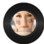
最爱Playlist Ingrid Michaelson的 《Be OK》